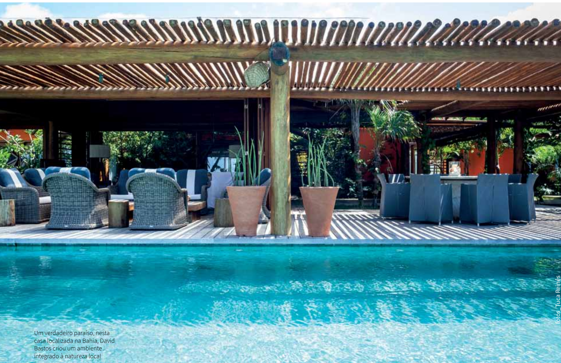
Um verdadeiro paraíso, nesta casa localizada na Bahia, David Bastos criou um ambiente integrado à natureza local